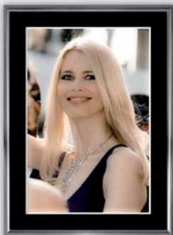
Espace Bernard Grange