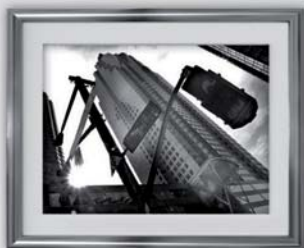
Jumelage au Canada